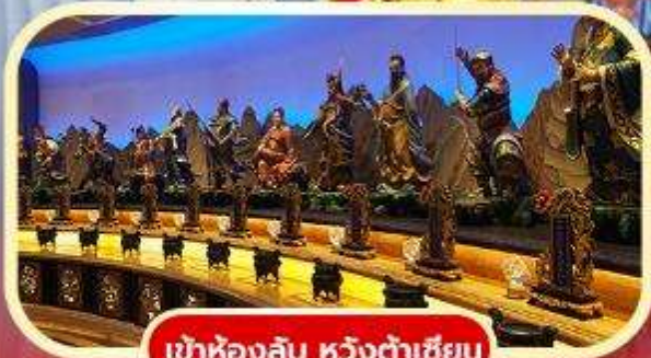
เข้าห้องลับ หวังต้าเซียน

พิเศษ | ✓ เข้าห้องลับ หวังต้าเซียน ✓ ล่องเรือข้ามเกาะเพ่งเจ้า