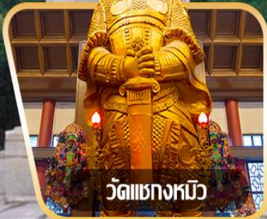
วัดเขangkงหวี