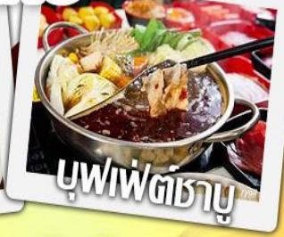
บุฟเฟ่ต์ชาบู