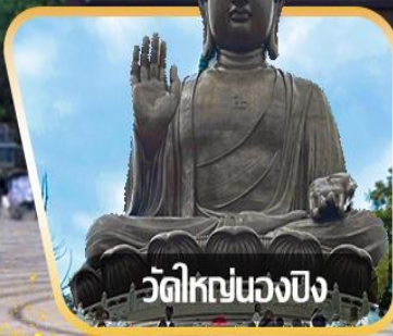
วัดใหญ่หนองบึง