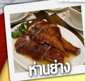
ก้านย่าง