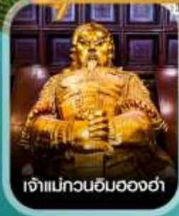
เจ้าแม่กวนอิมอองฮ่า