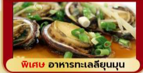
พิเศษ อาหารทะเลลิ้นห่าน

ฟรีดชน เสาร์-อาทิตย์ 07-09 มิถุนายน 2568