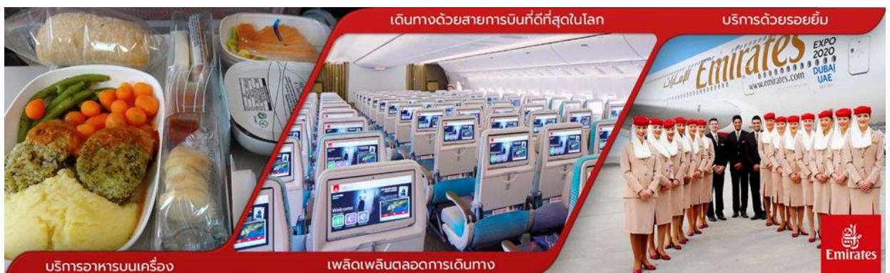
บริการอาหารบนเครื่อง

11.00 น. คณะพร้อมกันที่ สนามบินสุวรรณภูมิ ชั้น 4 ประตู 9 เคาน์เตอร์ T สายการบิน EMIRATES โดยมีเจ้าหน้าที่บริษัทคอยให้การต้อนรับ และอำนวยความสะดวกในด้านเอกสาร และการออกบัตรโดยสาร