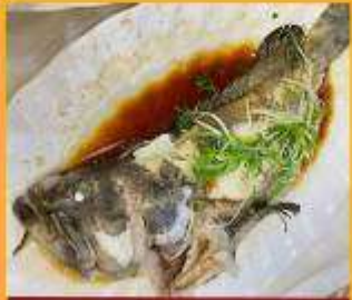
ปลาหนึ่งซีอิว