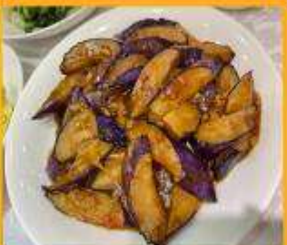
มะเขืออบหม้อดิน