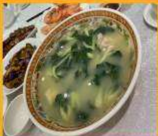
ซุปลวกใส่หมู