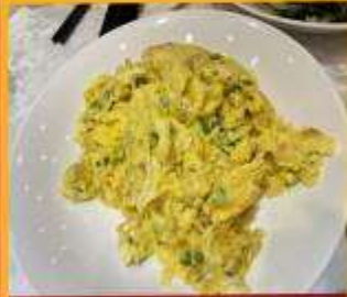
ไข่เจียวทรงเครื่อง