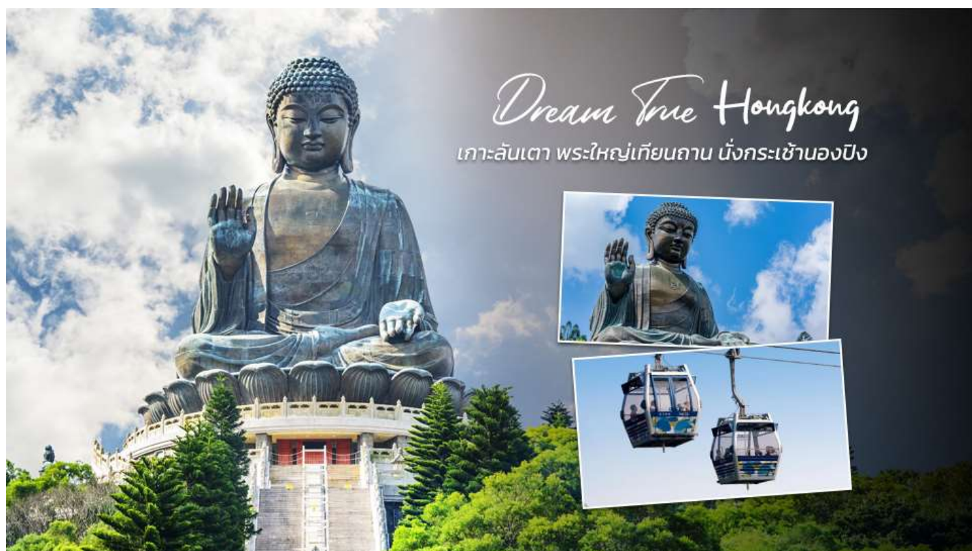
Dream True Hongkong เกาะลันเตา พระใหญ่เทียนถาน นั่งกระเช้านองปิง

ลันเตา หรือ พระพุทธรูปเทียนถาน (TIAN TAN BUDDHA STATUE) ที่ตั้งตระหง่านอยู่บนยอดเขาเมุกเย่ (MUK YUE) อาณาบริเวณของวัดโป้หลิน เป็นพระพุทธรูปทองสัมฤทธิ์กลางแจ้งที่ใหญ่ที่สุดในโลก มีความสูง 26.4 เมตร หากรวมฐานดอกบัวแล้วจะสูงถึง 34 เมตร องค์พระทำขึ้นจากการเชื่อมแผ่นทองสัมฤทธิ์กว่า 200 แผ่น เข้าด้วยกัน น้ำหนักรวม 250 ตัน หันพระพักตร์ไปทางด้านทะเลจีนใต้ และมองอย่างสงบลงมายังหุบเขาและโขดหินเบื้องล่าง ซึ่งการเดินขึ้นไปสักการะองค์พระใหญ่อย่างใกล้ซิดนั้น ต้องเดินขึ้นบันได จำนวน 268 ขั้น และได้รับเลือกให้เป็นสิ่งมหัศจรรย์ทางวิศวกรรมชั้นที่ 4 จากทั้งหมด 10 ชั้นของฮ่องกงในปี ค.ศ. 2000 ถือเป็นพระพุทธรูปองค์ใหญ่ที่เป็นสุดยอดของประติมากรรมทางพุทธศาสนาที่มีการผสมผสานระหว่างศิลปะสำริดแบบดั้งเดิมกับเทคโนโลยีสมัยใหม่ ชาวฮ่องกงเชื่อว่า หากใครได้มานมัสการขอพรองค์พระใหญ่แห่งนี้แล้ว ชีวิตก็จะมีแต่ความโชคดี มีความสุขสมหวัง และประสบความสำเร็จในทุกๆด้าน หลังจากไ้พระแล้วท่านสามารถเลือกซื้อของฝาก, ของที่ระลึก จากหมู่บ้านนองปิง อาทิเช่น หยก ไข่มุก หรือเครื่องประดับคริสตัล เพื่อเป็นของที่ระลึก จากนั้นนั่งกระเช้ากลับลงมายังสถานีตุงชุง