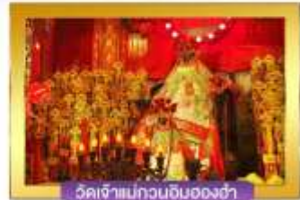
วัดเจ้าแม่กวนอิมของซ่า

เดินทางโดยสายการบินแอร์เอเชีย อาหาร : 3 มื้อ