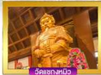
วัดเซกทงหมิว