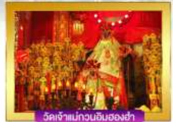
วัดเจ้าแม่กวนอิมของฮ่า