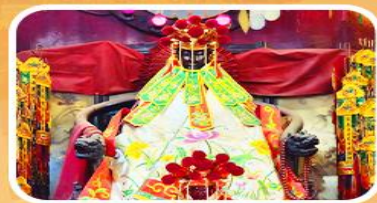
วัดเจ้าแม่กวนอิมสองอ่า