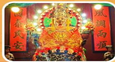
วัดเจ้าแม่กวนอิมเทียนหัว