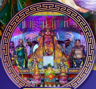
ศาลเจ้าหังเจีย