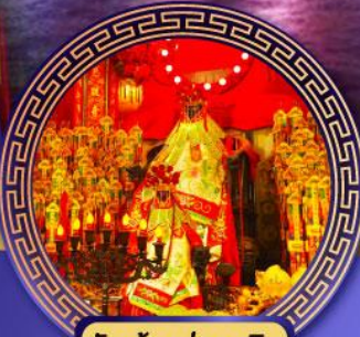
วัดเจ้าแม่กวนอิม ฮองฮ่า