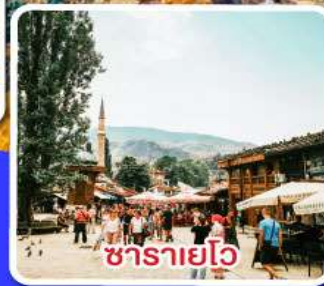
ซาราเยโว