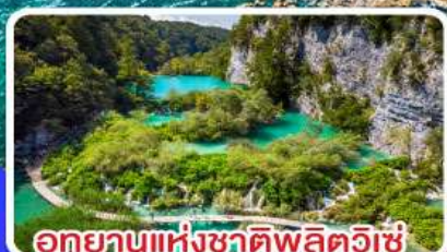
อุทยานแห่งชาติพลิตวิเช่