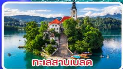
ทะเลสาบเบลด

ไข่มุกแห่งอาเดรียติก พร้อมขึ้นกระเช้า SRD