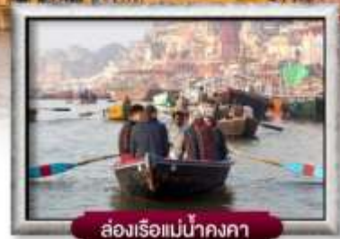
ส่องเรือแม่น้ำคงคา