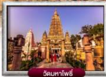
วัดมหาโพธิ์