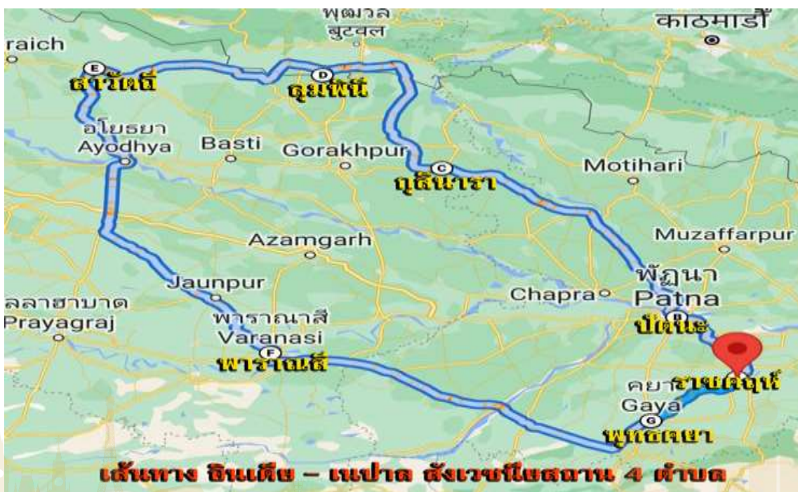
เส้นทาง 4 สังเวชนียสถาน - แปรตามสังเวชนียสถาน 4 ตำบล