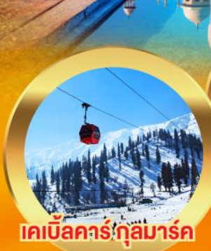
เคเบิลคาร์ ภูสุมาร์ค