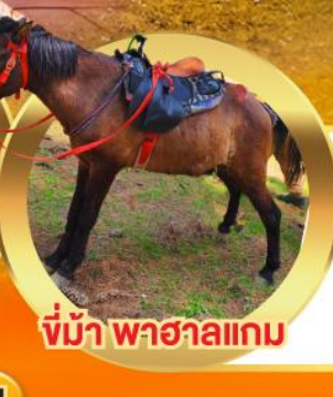
ขี่ม้า พาฮาลเกม