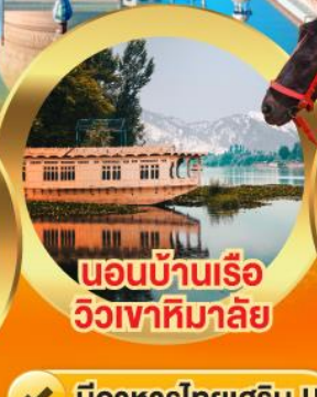
นอนบ้านเรือ วิวเขาหิมาลีย์