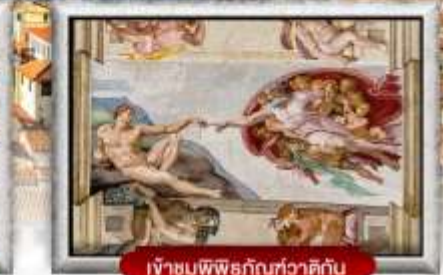
เข้าชมพิพิธภัณฑ์ทิวาติกัน

เมนูพิเศษ! สปาเกตตีเส้นหมึกดำ, พิชซ่าสไตล์อิตาลีเย็นแท้