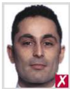
ใกล้เกินไป