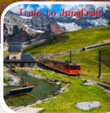
Train to Jungfrau