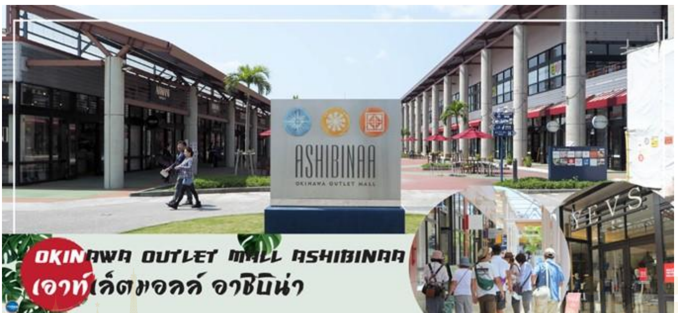
OKINAWA OUTLET MALL ASHIBINAA เอาท์เลตมอลล์ อาชิบิโน่า

จากนั้นนำท่านสู่ เอาท์เลตมอลล์ อาชิบิโน่า (Okinawa Outlet Mall Ashibinaa) (ใช้เวลาเดินทางประมาณ 30 นาที) เอาท์เลตแห่งแรกในโอกินาวะ รวบรวมร้านค้าชั้นนำกว่า 100 ร้าน ทั้ง