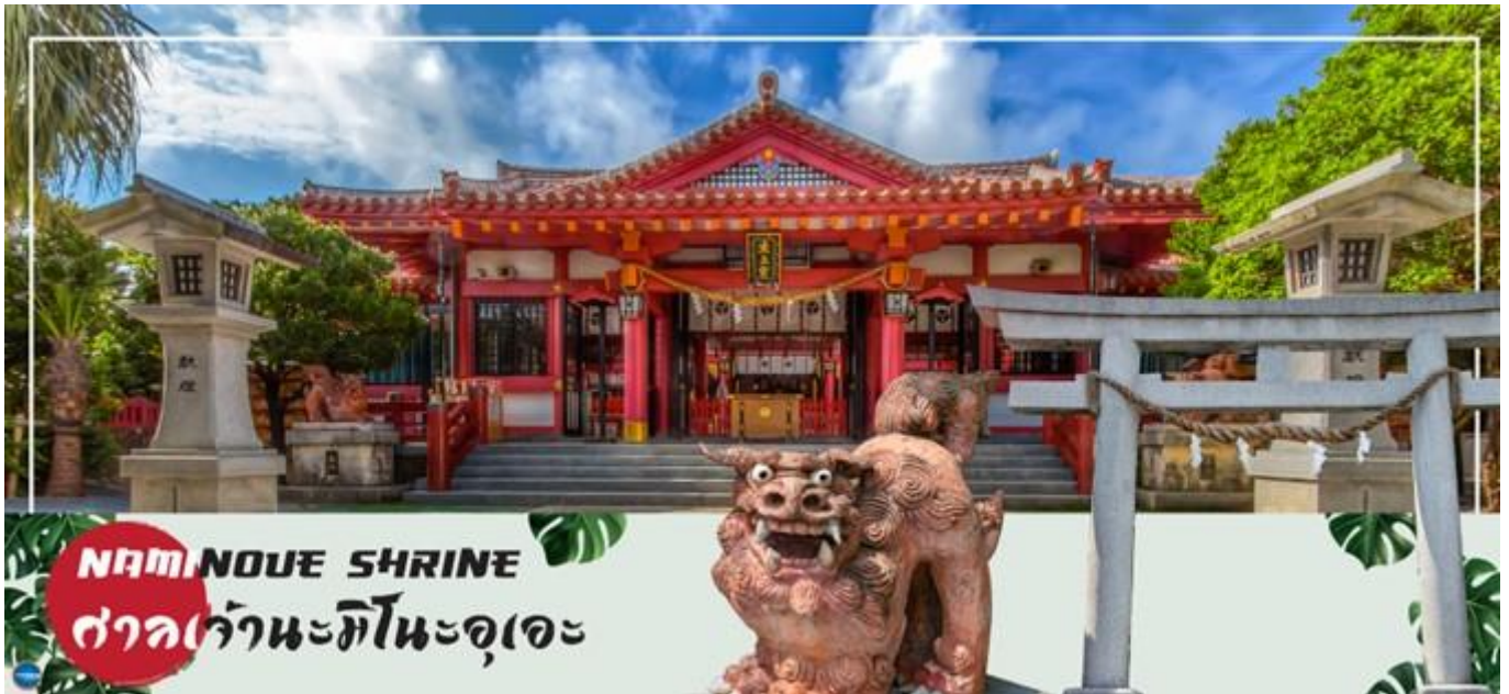
NAMINOUE SHRINE ศาลเจ้านามิโนะอุเอะ

วันที่สี่ ศาลเจ้านามิโนะอุเอะ – อาชิบิโน่า เอาท์เลตมอลล์ – ทำอากาศยานนาสะ โอกินาว่า – ทำอากาศยานดอนเมือง กรุงเทพฯ