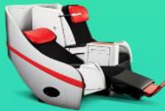
พรีเมียมฟลัดเบด