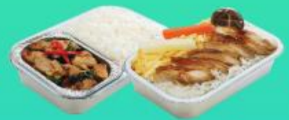
บริการอาหารร้อนบนเครื่องบิน บาป๋อ - ชาเกลือ