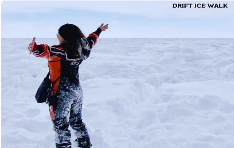
DRIFT ICE WALK

คุชิโระ-อะคัง-อะบาชิริ-ชิเรโตโกะ-โซฮุนเคียว-อาซาฮิกาวา-โอดารุ-ซัปโปโร