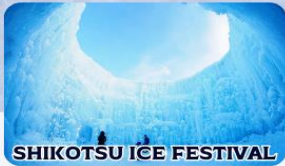
SHIKOTSU ICE FESTIVAL