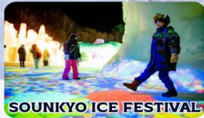
SOUNKYO ICE FESTIVAL