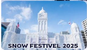
SNOW FESTIVAL 2025