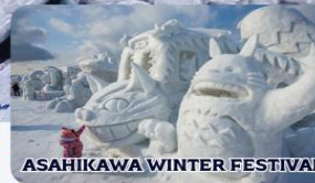
ASAHIKAWA WINTER FESTIVAL