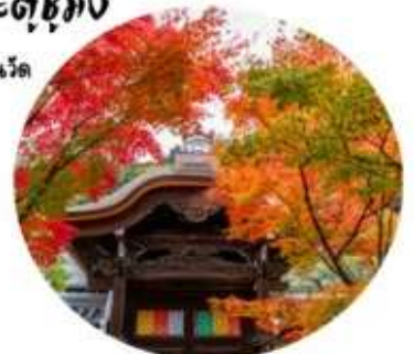
จุดประตูซุมง เป็นประตูด้านใน บริเวณด้านในวัด