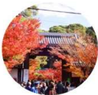
จุดประตูโซมง เป็นประตูทางเข้าหลักของวัดเอคันโด

ขนำท่านเยี่ยมชม วัดเอคันโด หรือที่รู้จักกันอีก 3 ชื่อ อาทิ เซนรินจิ โชจูโรโจเซ็ง และมูเรียวจูอิน วัดแห่งนี้ตั้งอยู่ทางฝั่งใต้ของ ทางเดินนักปราชญ์ (Philosopher's Path) ตรงใจกลางเมืองชิงายามะ พื้นที่ตรงนี้กว้างใหญ่โดยมีอาคารมากมายที่เชื่อมถึงกันด้วยทางเดินแบบมีหลังคาคลุม วัดแห่งนี้คือของขวัญที่ขุนนางตุลาการในสมัยเฮอัน (ปี 794-1185) มอบให้พระสงฆ์ ภายในวัดเต็มไปด้วยงานศิลปะหลากหลายชิ้น โดยชิ้นที่มีชื่อเสียงที่สุดคือรูปปั้นพระอมิตาพุทธ ซึ่งพระเศียรหันไปด้านหนึ่งแทนที่จะมองตรงมาทางด้านหน้าอย่างที่เห็นกันตามปกติ ตำนานเล่าไว้ว่า ขณะที่เจ้าอาวาสประกอบพิธีสำหรับพระพุทธรูปองค์นี้ ท่านได้เห็นมามองและพูดคุยกับเจ้าอาวาส อีกทั้งยังเป็นวัดที่รู้จักกันดีว่ามีใบไม้ที่สวยงามมีชื่อเสียงในการชมใบไม้เปลี่ยนสีในช่วงฤดูใบร่วงตอนประมาณปลายเดือนพฤศจิกายนถึงต้นเดือนธันวาคม โดยจะงดงามมากขึ้นไปอีกจากแสงที่มาตกกระทบยามเย็น ภายในวัดมีมุมถ่ายรูปกับใบไม้เปลี่ยนสีมากมาย อาทิ