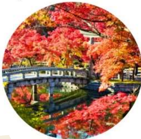
จุดร้านน้ำชา และนกพิราบ ที่ให้ภาพบรรยากาศที่งดงามของลานหนึ่งสีแดง ที่ปกคลุมไปด้วยใบไม้เปลี่ยนสี

บ่อน้ำที่อยู่ใจกลางวัด มีสะพานข้ามมายังศาลเจ้าถือเป็นจุดถ่ายภาพยอดนิยม