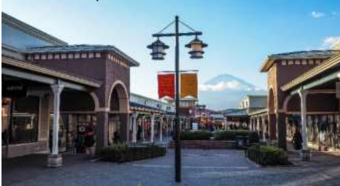
ช้อปปิ้งจุใจเต็มเวลา โกเทมบะ เอ้าท์เล็ตส์