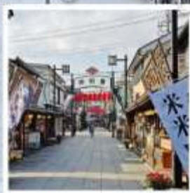
เมืองโบราณชิยามาตะ