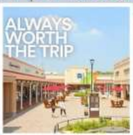
ชิซุชิ ฟรีเมียม เอาก์เล็ท