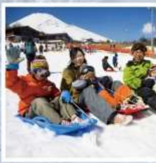
ลานสกีเยติ

สักการะพระใหญ่ไดบุทสึองค์ศักดิ์สิทธิ์ ณ วัดโคโตคุอิน ช้อปปิ้งชิซุชิ ฟรีเมียม เอาก์เล็ท อย่างจุใจ ย้อนยุคข้ามกาลเวลาสู่ถนนสายโชวะ ณ ชิยามาตะ ล่องเรือกลางทะเลสาบอาโกเน่ บรรยากาศที่ต้องมาเยือน มิซึมะ สกายวอล์ค สะพานแขวนที่ยิ่งใหญ่ที่สุดในญี่ปุ่น เพลิดเพลินไปกับกิจกรรมหิมะ สกีเยติ สกีเดี่ยวที่อยู่บนภูเขาไฟฟูจิ พัคออนเซ็น 1 คับ!!! / พัคนาริตะ 3 คับ อาหารพิเศษ...บุฟเฟต์ซาบูยักซ์, บุฟเฟต์ปิ้งย่าง กรุ๊ปสบายๆ เพียง 25 ท่านเท่านั้น!!!