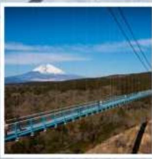
มิซึมะ สกายวอล์ค