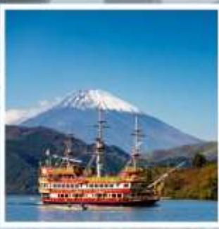
ล่องทะเลสาบอาชิ