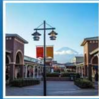
ช้อปปิ้งโทกემบะ

สักการะพระใหญ่โตบุคสี ที่วัดโคโตคุอินก่อนสิ้นปี ช้อปปิ้งโทกემบะ ฟรีเมียม เจ้าท์เลิสส์ อย่างจุใจ เต็มเวลา หมู่บ้านโอชิโนะฮัคไก หมู่บ้านน้ำใสคึกคักดีสิทธ์ ประสบการณ์แสนสนุก ล่องคาบะบัส ชมฟูจิ สัมผัสวัฒนธรรมเช้าของเหล่าคนญี่ปุ่น ณ ตลาดปลาซึกิจิ เก็บภาพความประทับใจ ณ วัดโอโคะคุจิ ป่าไฟแห่งคามาคูระ พักออนเซ็น 1 คืน // อาหาร : บุฟเฟ่ต์ชาบูไม่อื่น บุฟเฟ่ต์ชาบู อิสระฟรีเดย์ 1 วัน โรงแรมไกล์รถไฟฟ้า 3 สาย ที่โตเกียว 2 คืน