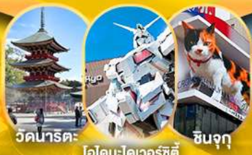
วัดนาริตะ ไอโดบะ-ไคเวอร์ซิตี ชินจูกุ

อิสระท่องเที่ยวตามอัธยาศัย หรือเลือกซื้อทัวร์เสริมโตเกียวดิสนีย์แลนด์ วัดอาซากุสะ ถนนนากามิเซะ ซ้อปิ้งชินจูกุ อโอมอลล์ ไอโดบะ ไคเวอร์ซิตี วัดนาริตะ