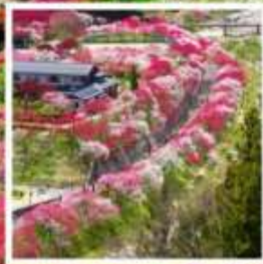
สวนฮานาโมโมะ โนะ ซาโตะ