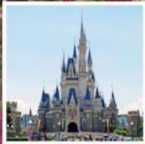
โตเกียว ดิสนีย์แลนด์