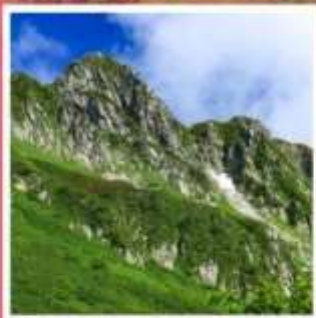
กระเช้าลอยฟ้าโคมากะทาเคะ