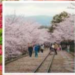
เคอะเคะ อินโคลน์