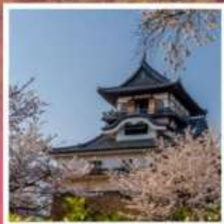
ปราสาทฮิยามะ