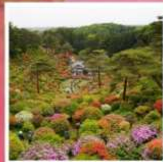
วัดชิโอะฟูเนะ คันนงจิ

โตเกียวดิสนีย์แลนด์ ดินแดนในฝันของคนทั้งโลก ฮานาโมโมะ โนะ ซาโตะ ดอกทิวลิปหลากสีที่รอคุณมาเยือน ทางรถไฟสายเก่า เคอะเคะ อินโคลน์ 1 ในจุดชมซากุระที่สวยงามแห่งเกียวโต ปราสาทฮิยามะ 1 ใน 12 ปราสาทดั้งเดิมกับทิวทัศน์อันแสนสวยงาม ขึ้นกระเช้าที่สูงที่สุดในญี่ปุ่น โคมากะทาเคะ คับแองเก็อกเขาสุดอัศจรรย์เข็นโจจิกิ เซอร์ค ชิโอะฟูเนะ คันนงจิ วัดแห่งดอกไม้สุด unseek ที่ไม่ควรพลาด พักออบเชิน 2 คืน!!! // อาหารพิเศษ...บุฟเฟ่ต์บึงย่าง, บุฟเฟ่ต์ซาบู, บุฟเฟ่ต์ซาบู กรุ๊ปมากมาย เพียง 20 ท่านเท่านั้น!!!