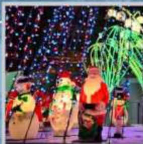
"ODORI GERMAN CHRISTMAS"