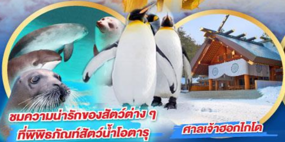
ชมความน่ารักของสัตว์ต่างๆ ที่พิพิธภัณฑ์สัตว์น้ำโอตารุ