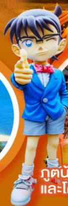
กตน้อย คิตาโร่ และโคนัน