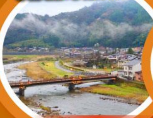
มิซาซะออนเซน

เที่ยวเต็มทุกวันไม่มีฟรีเวย์ ชมเนินทรายกตไตรที่ใหญ่ที่สุดในญี่ปุ่น ตามรอยกตน้อย คิตาโร่ และโคนัน นั่งกระเช้าชมวิว 1 ใน 3 ที่สวยที่สุดในญี่ปุ่น “อามาโนะ ฮาชิคาตะ”