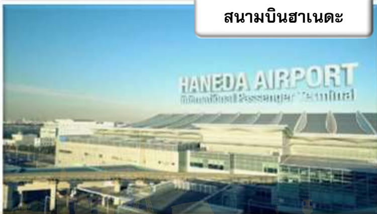
สนามบินฮาเนดะ

เวลา 06.55 น. เดินทางถึง สนามบินฮาเนดะ ประเทศญี่ปุ่น นำท่านผ่านขั้นตอนการตรวจคนเข้าเมืองและศุลกากร