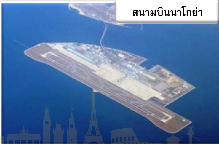
สนามบินนาโกย่า

เวลา 00.05 น. ออกเดินทางสู่ สนามบินนาโกย่า ประเทศญี่ปุ่น โดย สายการบินไทย เที่ยวบินที่ TG 644