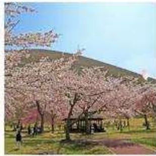
ซากุระ โนะ ซาโตะ