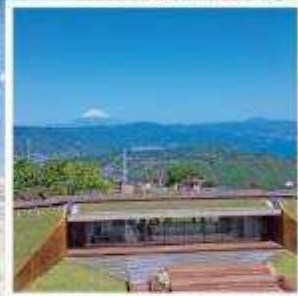
มิโระ คาเฟ่321