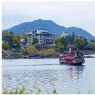
ล่องเรืออูปปะระ