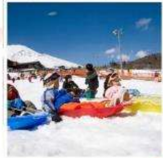
ลานสกีเยติ