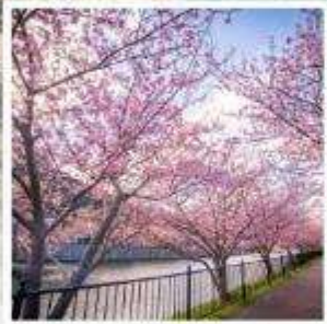
เทศกาลคาวาซุ ซากุระ