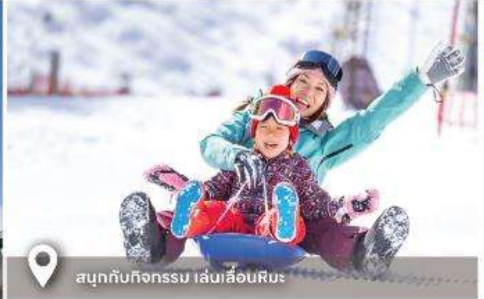
สนุกกับกิจกรรม เล่นเลื่อนหิมะ