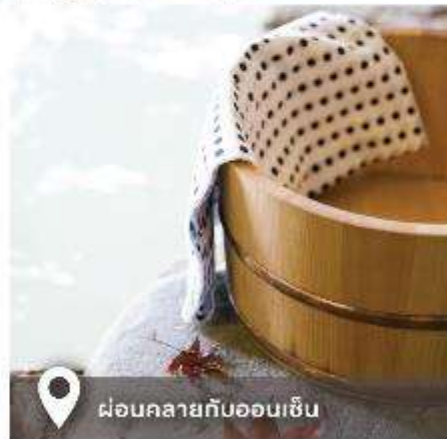
ผ่อนคลายกับออนเซ็น