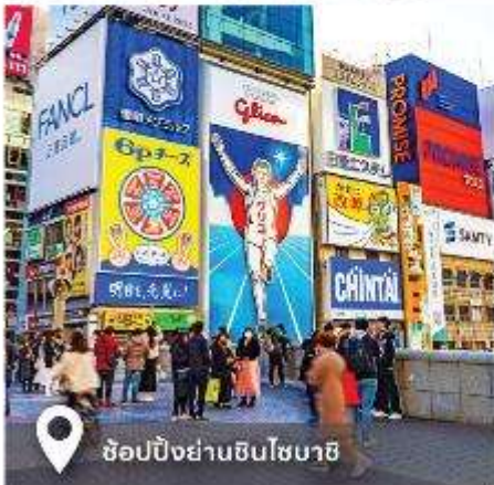
ช้อปปิ้งย่านชินโซบาชิ