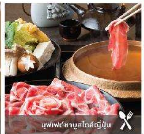
บุฟเฟต์ซาบุมิโตลส์ญี่ปุ่น