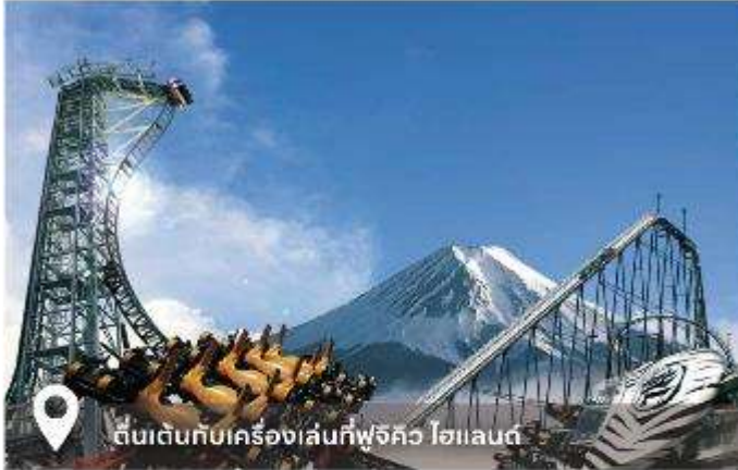
ตื่นเต้นกับเครื่องเล่นที่ฟูจิคว โฮแลนด์