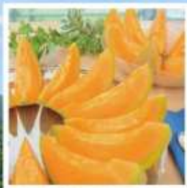
ศูนย์จำหน่ายเมล่อนยูบาริ