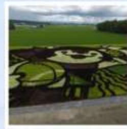
ศิลปะบนนาข้าว