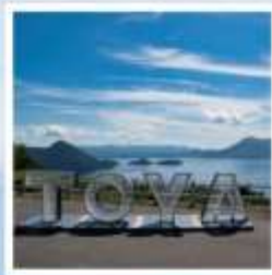
จุดชมวิวจิโตะ

ชมวิวที่สวยงามที่สุดบนทะเลสาบโทโยะ ณ จุดชมวิวจิโตะ เมืองสุดแสนโรแมนติก กับถนนสายของหวานชื่อดัง โอตารุ ศิลปะบนนาข้าว เรื่องราวในทุ่งนาสะท้อนจิตวิญญาณแห่งฮอกไกโด ที่ 1 ปี มีครั้งเดียว กิน กิน และ กิน จูใจไปกับเมล่อนเขียนจำแบบไม่จืด ชมฟาร์มโคนมชื่อดัง นิเซโกะ ทาคาฮาชิ กับวิวโยเทแสนพิเศษ สวนดอกไม้กับวิวเทือกเขาที่โด่งดังที่สุดแห่งฮอกไกโด ณ สวนชิชิโนะโอกะ พักออนเซ็น 1 คืน!!! พักในเมืองชิปปุโร 2 คืน เมนูพิเศษ...บุฟเฟ่ต์เมล่อน, บุฟเฟ่ต์ชาบู, บุฟเฟ่ต์ชาบู, บุฟเฟ่ต์บิงย่าง กรุ๊ปสบายๆ เพียง 20 ท่านเท่านั้น!!!