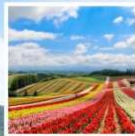
สวนดอกไม้ชิชิโนะโอกะ