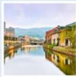
เมืองโอตารุ