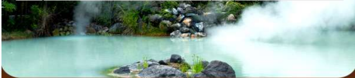
รายการทัวร์อาจมีข้อเปลี่ยนแปลงตามความเหมาะสม โดยดูสถานการณ์ประจำวันเป็นหลัก #ที่จะเกี่ยวข้องกรุณาทราบ