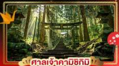
ศาลเจ้าคามิซึกิมิ