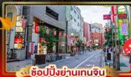
ช้อปปิ้งย่านเทนจิน