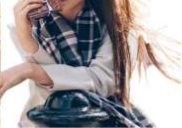
โรงงานช็อคโกแลต "อิชิยะ" (Ishiya Chocolate Factory)

ท่านสามารถชมขั้นตอนการทำช็อคโกแลตที่ขึ้นชื่อของเมืองซัปโปโร โดยเฉพาะSHIROI KOIBITO ขนมสอดไส้ช็อคโกแลต ชาวที่เป็นที่นิยมทั่วทั้งเกาะฮอกไกโด และพิพิธภัณฑ์ช็อคโกแลต ชมถ้วยชามที่ใช้สำหรับใส่ช็อคโกแลตที่มีความสวยงามเป็นเอกลักษณ์ และเหล่าของเล่นย้อนยุคที่ทำให้คุณ ๆ ต้องแอบบอมบิ้มอยู่ในใจ และรู้สึกเหมือนย้อนเวลากลับไปในอดีตอีกครั้ง และแนะนำให้ท่านชิมชา หรือกาแฟร้อนของที่นี่ พร้อมทั้งสิ่งขนมเค้กแสนอร่อยราดด้วยช็อคโกแลตเข้มข้น ในส่วนที่เป็นคอฟฟีฟีอ็อฟ บริเวณชั้น 2 ของอาคารทรงสไตล์ยุโรป (อิสระให้ท่านถ่ายรูปบริเวณด้านนอก ไม่รวมตัวค่าเข้าชมภายใน)