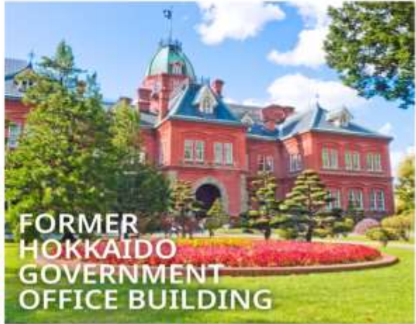
FORMER HOKKAIDO GOVERNMENT OFFICE BUILDING

เป็นตึกสไตล์นีโอเรอเนสซองส์ มีลักษณะพิเศษที่มีหลังคายอดแหลมและกรอบหน้าต่างเป็นเอกลักษณ์ เปรียบเสมือนอนุสาวรีย์การบุกเบิกของฮอกไกโด ปัจจุบันได้รับการขึ้นทะเบียนเป็นมรดกทางวัฒนธรรมของชาติ