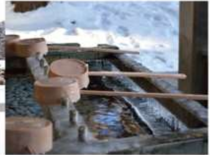
ศาลเจ้าฮอกไกโด

เป็นศาลเจ้าของศาสนาพุทธนิกายชินโตประจำเกาะฮอกไกโด สร้างขึ้นในปี 1871 ยุคเริ่มพัฒนาเกาะ ได้อัญเชิญเทพมาประทับทั้งหมด 4 องค์ จากศาลเจ้ามีพื้นที่เชื่อมต่อกับสวนมารุยามะ ในฤดูใบไม้ผลิเหมาะแก่การชมดอกซากุระบาน ในฤดูร้อน วันที่ 14-16 มิถุนายนของทุกปี จะจัดเทศกาล Sapporo Festival หรือ Sapporo Matsuri ซึ่งจะแห่ขบวนไปตามถนน