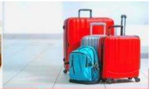
น้ำหนักกระเป๋า สูงสุด 20 กก.

08:40 ถึง สนามบินคันไซ ประเทศญี่ปุ่นดินแดนอาทิตย์อุทัย หลังผ่านพิธีศุลกากรและตรวจคนเข้าเมืองพร้อม รับสัมภาระเรียบร้อยแล้ว