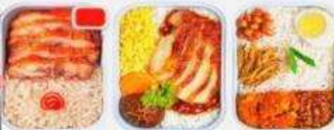
บริการอาหารร้อน ทั้งขาไป-ขากลับ