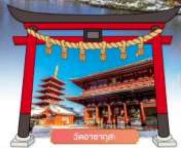
วัดฮาซาคุระ

เดินทางโดยสายการบิน : ไทยแอร์เอเชียเอ็กซ์