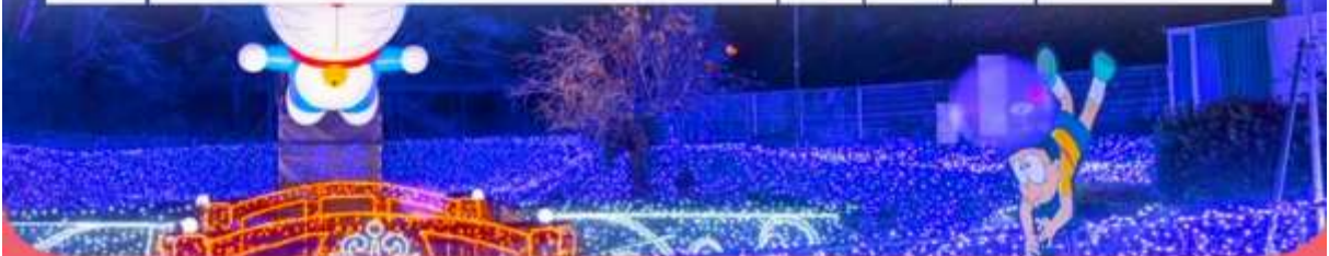
รายการทัวร์อาจมีเปลี่ยนแปลงตามความเหมาะสม โดยดูสถานการณ์ประจำวันเป็นหลัก สำหรับเที่ยวครบทุกรายการ