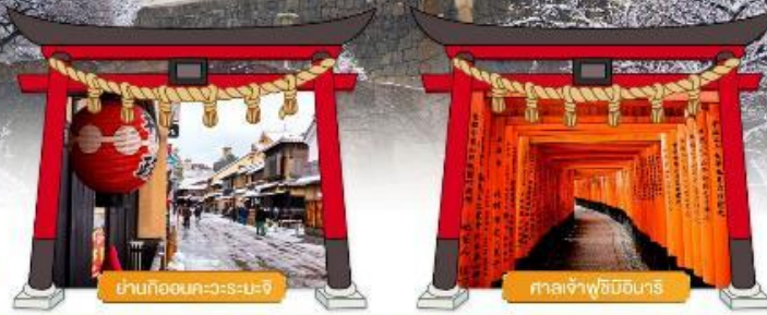
ย่านกิออนคะวะระมะจิ

✓ เพลิดเพลินกิจกรรมท่ามกลางหิมะ ในลานสกีเทรนสโนว์โอคุอินุคิ