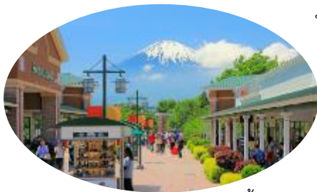
บั้งตามอัธยาศัย

จากนั้นนำท่านชม เสาโทริอิแดงพันต้น ณ ศาลเจ้าโอดะมะ อินาริ ที่เรียงรายไปตามถนนที่มุ่งหน้าไปสู่ชะเดิน (ศาลาศาลเจ้า) มีความสวยงามมากอีกสถานที่หนึ่ง อีกทั้งที่ศาลเจ้าแห่งนี้ยังมีต้นไม้ศักดิ์สิทธิ์ที่ว่ากันว่าทำให้คำอธิษฐานของงูเผือกเป็นจริง อิสระให้ท่านเดินเที่ยวชมตามอัธยาศัย ไม่รวมค่าเข้าชมสวนดอกไม้ราคาท่านละ 200 เยน