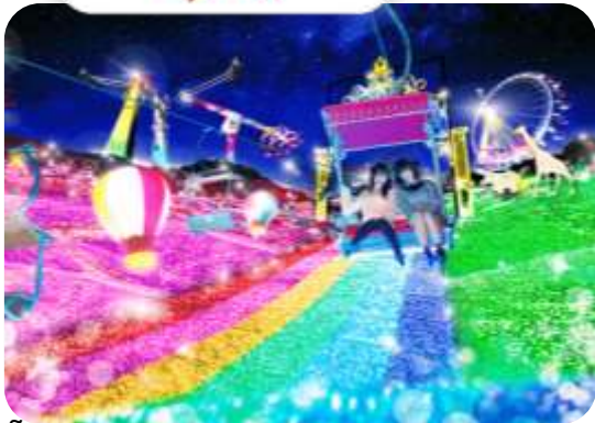
โปรแกรมเดินทาง 5 วัน 4 คืน AIR ASIA X

โตเกียว นาริตะ ฟุจิ อิบารากิ นิกโก้ ลานสกีฟูจิเกิน