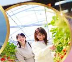
บุฟเฟต์ สดอเบอร์รี่ เก็บสดจากต้น