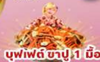
บุฟเฟต์ ซาปู 1 มื้อ