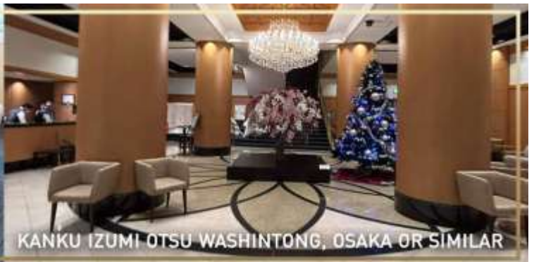
KANKU IZUMI OTSU WASHINTONG, OSAKA OR SIMILAR

วันที่ 5 สนามบินคันไซ – กรุงเทพ (ดอนเมือง)