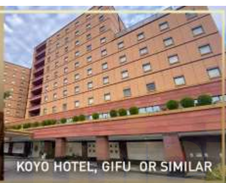
KOYO HOTEL, GIFU OR SIMILAR