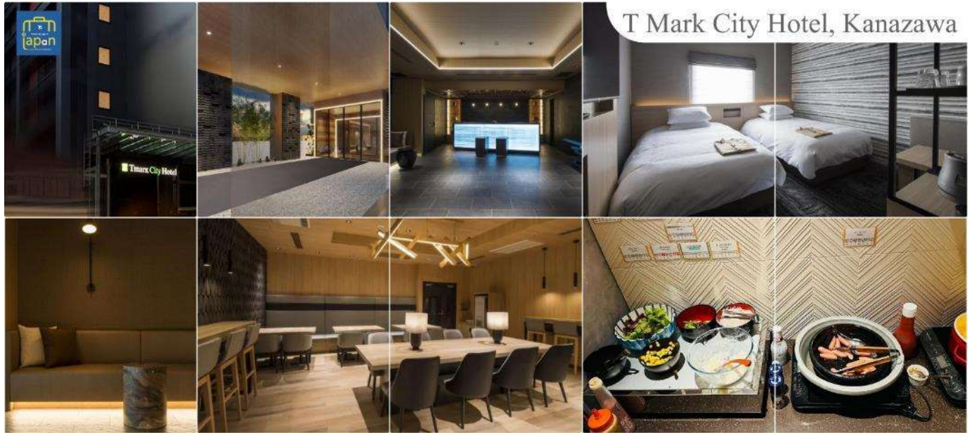
T Mark City Hotel, Kanazawa

TMARK CITY HOTEL, KANAZAWA หรือเทียบเท่าระดับเดียวกัน