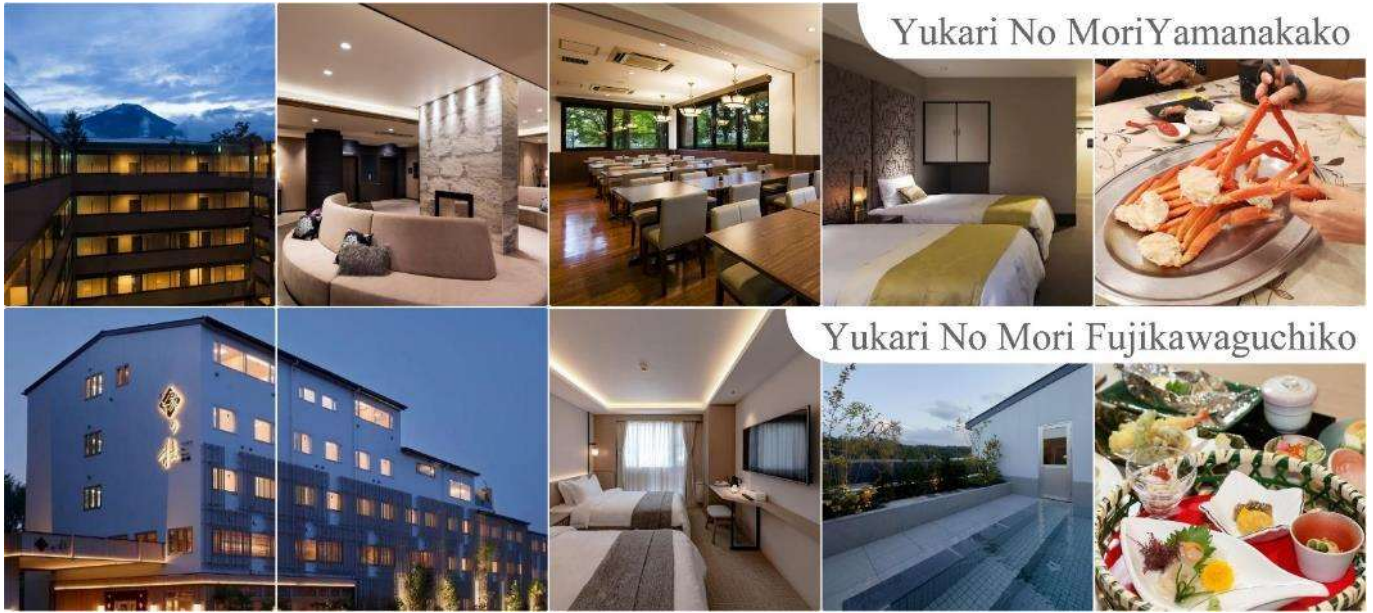
Yukari No Mori Yamanakako

จากนั้นให้ท่านได้ผ่อนคลายกับการ แช่น้ำแร่ออนเซ็นธรรมชาติ เชื่อว่าถ้าได้แช่น้ำแร่แล้ว จะทำให้ผิวพรรณสวยงามและช่วยให้ระบบหมุนเวียนโลหิตดีขึ้น