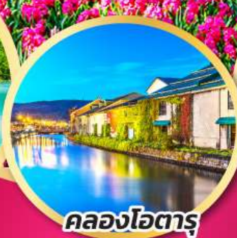
คลองโอดารุ