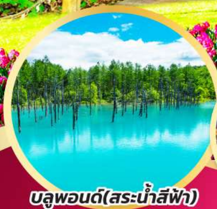
บลูพอนด์(สระน้ำสีฟ้า)