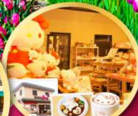
ร้านกาแฟ อัลโหล คิตตี้