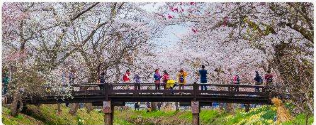
หมู่บ้านน้ำใสโอชิโนะ อักโก

โอชิโนะ อักโก หรือ ที่รู้จักกันในชื่อ หมู่บ้านน้ำใส ความงามแห่งธรรมชาติและวัฒนธรรมที่ ซ่อนอยู่ใต้เงาภูเขาไฟฟูจิโอชิโนะ อักโก ตั้งอยู่ในหมู่บ้านโอชิโนะ จังหวัดยามานาชิ ประเทศญี่ปุ่น เป็นแหล่งน้ำธรรมชาติที่มีชื่อเสียง ประกอบด้วยบ่อน้ำใสสะอาดทั้งแปดแห่ง ซึ่งน้ำในบ่อเหล่านี้เกิด จากการละลายของหิมะและน้ำแข็งจากภูเขาไฟฟูจิ น้ำที่ไหลลงมานั้นได้ถูกกรองผ่านชั้นหินภูเขาไฟ