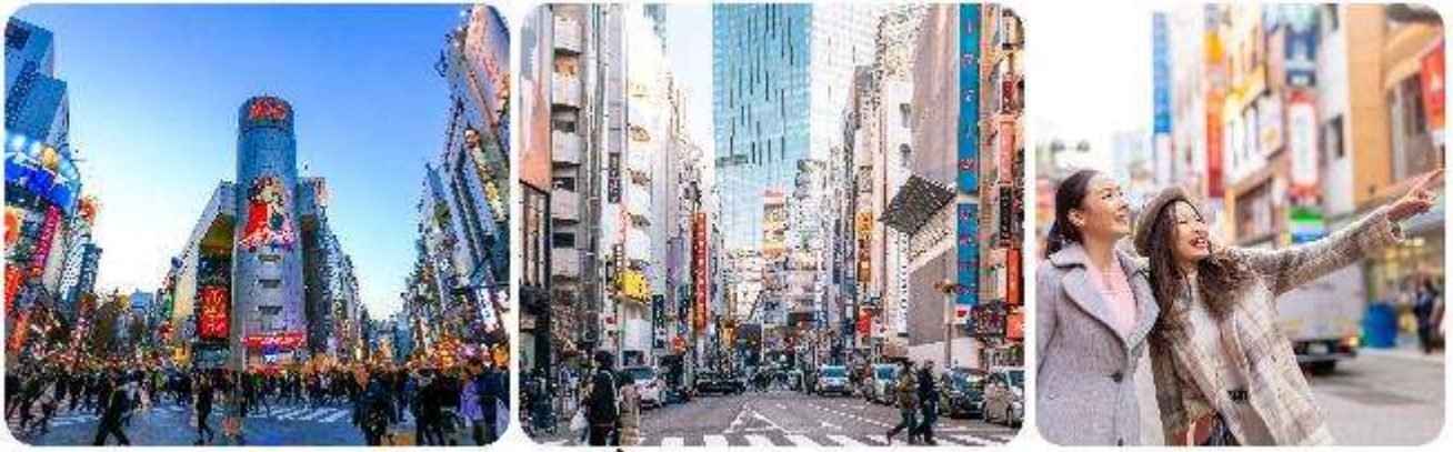
ช้อปปิ้งใจกลางกรุงโตเกียว