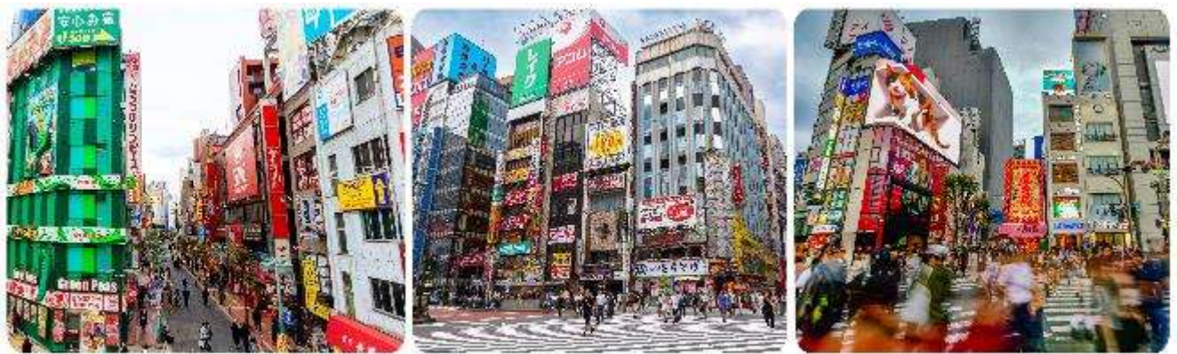
ช้อปปิ้งใจกลางกรุงโตเกียว - ชินจูกุ

มื้อกลางวัน บริการท่านด้วย ชุดอาหารญี่ปุ่นเบนโตะ