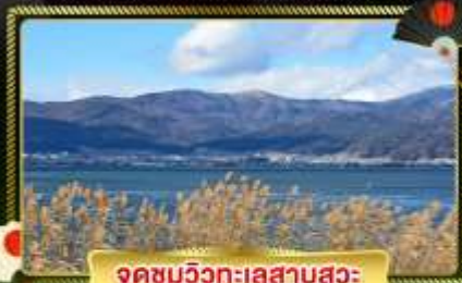
จุดชมวิวกะเลสาบสุมะ