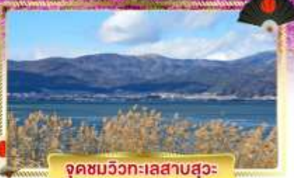
จุดชมวิวกะเลสาบสุวะ