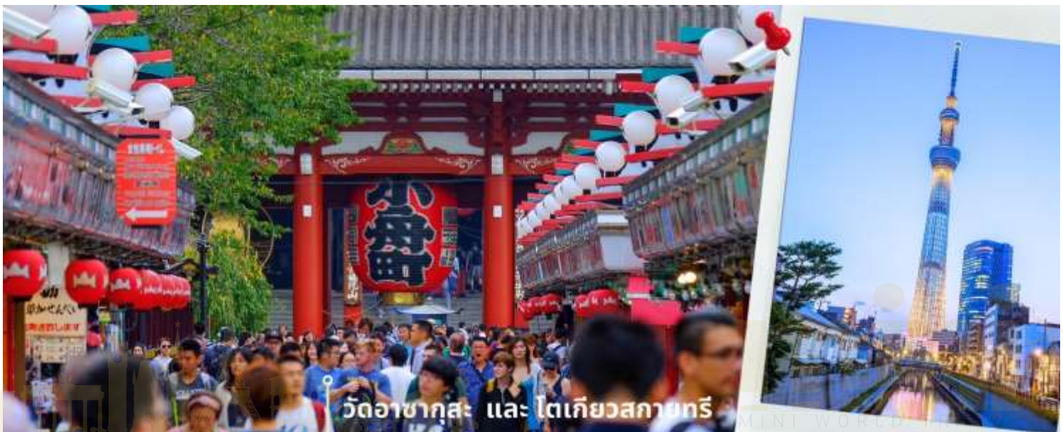
วัดอาซากุสะ และ โตเกียวสกายทรี

08.00 น. เดินทางถึงสนามบินนาริตะ ประเทศญี่ปุ่น หลังจากผ่านพิธีตรวจคนเข้าเมืองและศุลกากรแล้ว นำท่านขึ้นรถโค้ชปรับอากาศ จากนั้นเดินทางสู่ เมืองโตเกียว พาท่านสักการะ ที่ วัดอาซากุสะ (Asakusa Temple) วัดที่ได้ชื่อว่าเป็นวัดที่มีความศักดิ์สิทธิ์และได้รับความเคารพนับถือมากที่สุดแห่งหนึ่งในกรุงโตเกียวภายในประดิษฐานองค์